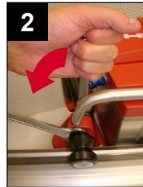
Allentare il rullo