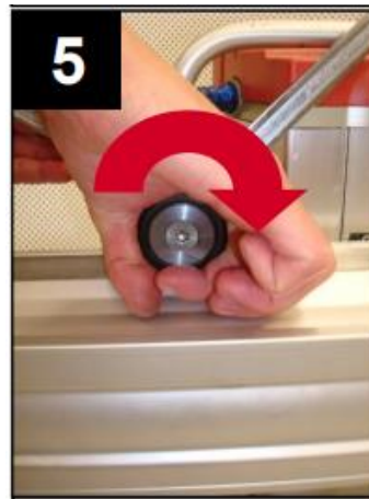
Controllo dei rulli che non siano troppo stretti, devono essere liberi