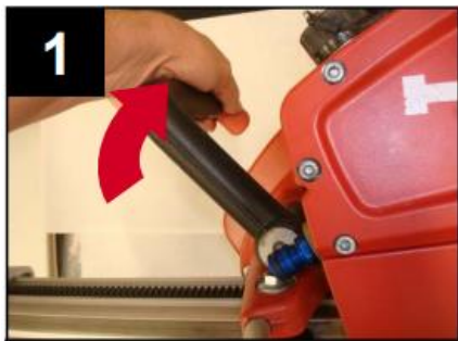
Fissare la testa di taglio sul binario

Per migliorare l'uso del tuo utensile, i nostri tecnici ti consigliamo di: